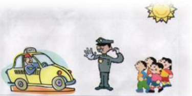
Κυκλοφορώ με ασφάλεια στο δρόμο