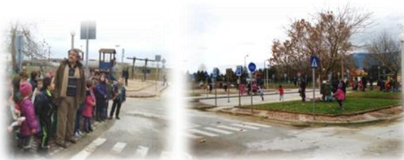
Επίσκεψη στο πάρκο Κυκλοφοριακής Αγωγής Χρυσούπολης

Τα αποτελέσματα έρευνας που κάναμε στην τάξη μας έδειξαν ότι οι περισσότεροι μαθητές έρχονται στο σχολείο με αυτοκίνητο, δύο έρχονται με λεωφορείο, λιγότεροι από τους μισούς έρχονται με τα πόδια και κανένας δεν έρχεται με ποδήλατο