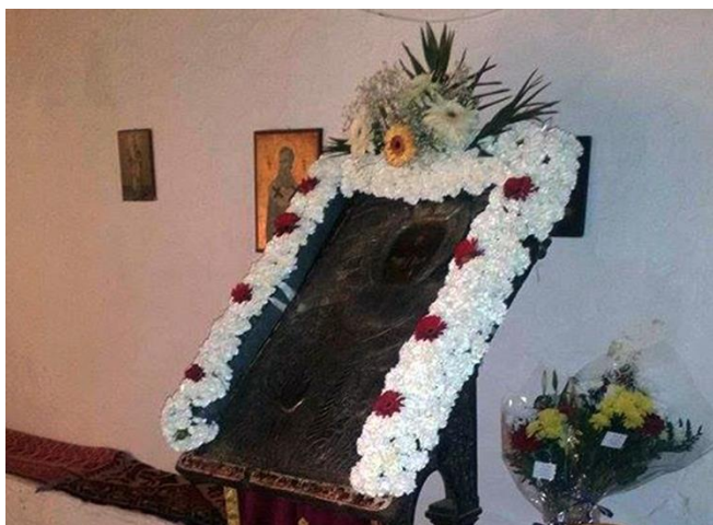
Εικόνα 1. Η ανθοστόλιστη εικόνα του Αγίου Αθανασίου

Πολιούχος του χωριού μας είναι ο Άγιος Αθανάσιος και τη μνήμη του γιορτάζουμε στις 18 Ιανουαρίου και στις 2 Μαΐου. Η εκκλησία βρίσκεται στον ορεινό ιστορικό οικισμό Κάστρο. Εμείς στη Θάσο διατηρούμε τα έθιμά μας και ανεβαίνουμε στο Κάστρο καθιερώνοντας ένα έθιμο, που θα μπορούσε να ονομαστεί: «όλο το χωριό μια οικογένεια». Κάτοικοι και επισκέπτες γυρνούν από σπίτι σε σπίτι πίνοντας και τραγουδώντας για τη χάρη του Αγίου. Ανήμερα της γιορτής μαζευόμαστε όλοι και μετά τη λειτουργία, μαζί με τον δήμαρχο, κόβουμε μια μεγάλη βασιλόπιτα και μοιράζεται το κλουμπάνι. Είναι παραδοσιακό φαγητό με κρέας και ρύζι. Τα παιδιά κάθονται στην πλατεία και οι γονείς μαζεύονται στα σπίτια και ετοιμάζουν φαγητό. Εκείνη την ημέρα όλοι διασκεδάζουν ως αργά το βράδυ. Την επόμενη οι περισσότεροι φεύγουν από τον οικισμό. Όμως όλοι ανυπομονούμε για την επόμενη φορά που θα τιμήσουμε τη μνήμη του Αγίου Αθανασίου.